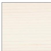
7266 Белая ель прозрачный